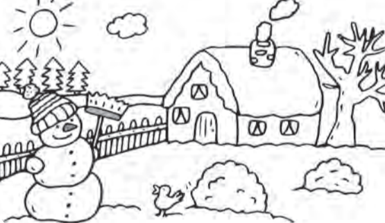
در دو تصویر زیر ده اختلاف پیدا کنید

اما بزبزک زنگوله‌ها، دلش برای گرگ سوخت. یک طرف آش هم برای او کشید و پشت در گذاشت.