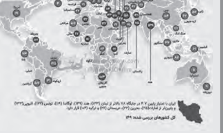
ایران در شانزدهم کشور جهان قرار دارد.

طبق تحقیقات، غلظت پلاسمای خون افراد شاد کمتر از حدی است که اکثر بیماری‌ها توان فعالیت را داشته باشند.