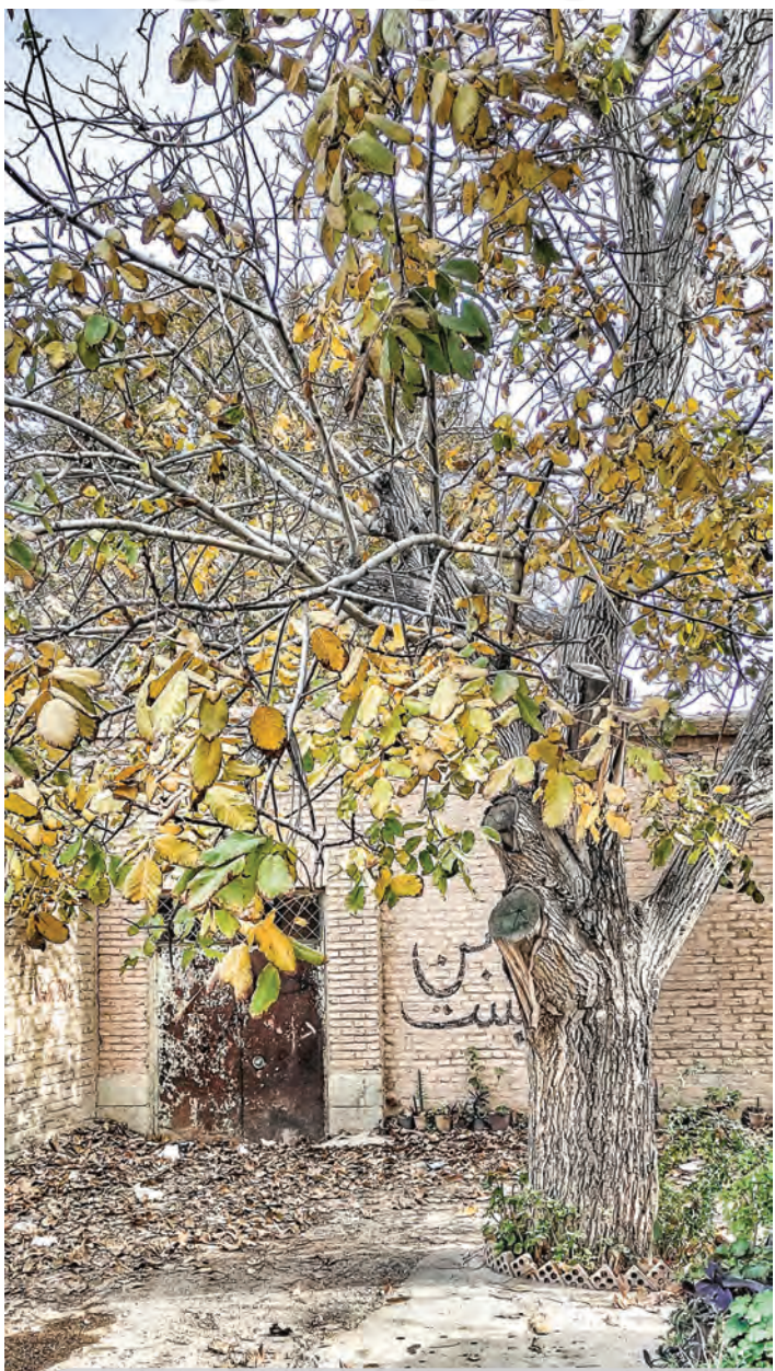
بن بست پاییز...

کوچه کنجبهشت/ محله سادات/ پاییز ۱۴۰۰