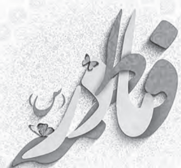
وعدت حضرت فاطمه (س) از سرور مادران اسلام (ع)

از همین رو بر تمامی جوانان ایران زمین از مسلمان و غیر مسلمان، تمام کسانی که حب دین، میهن و وطن در دل دارند لازم است تا بیشتر و بیشتر مادر خود را احترام کنند و خود را خاک پای مادر بدانند. کلام آخرین که: آنچنان بالاست ارج و احترام مادران گره به دقت بنگری هر روز، روز مادر است!