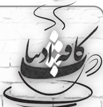
په کوشن فاطمه زدنشتی نی‌ریزی